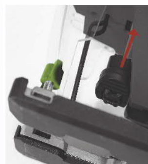
NEW EASY BLADE QUICK CHANGE SYSTEM