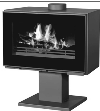
PAB830-P = Ref 100006 Z100 MAX G