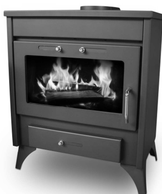
PAB1300 = Ref 100605 Q100 MAX