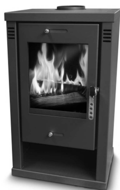
PAB752 = Ref 100651 L101