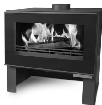
PAB830 = Ref 100005 Z100 MAX