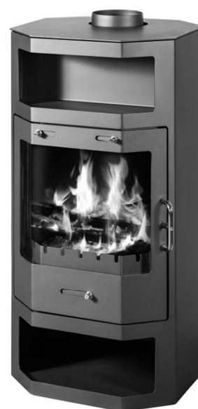
PAB1400 = Ref 100010 GL100