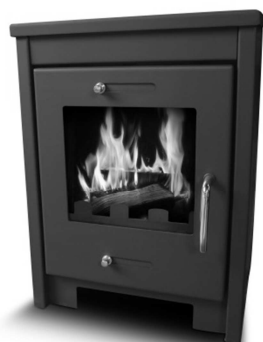
PAB800 = Ref 100600 Q100 LUX SM