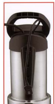
ELECTRONIC SENSOR Automatic switch on/off